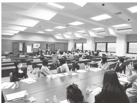
【地域拡大幹事会の様子】

意見交換では、女性部会から女性定着につなげるために協会主催の経営者や管理職を対象とした女性が働きやすい環境創出に関係するセミナーの開催、建設業を知らない小中学生に興味・関心を持ってもらえ、そして女性も働けるんだという選択肢を増やせるように出張PRの改善などの提案があった。正副会長からは、各会員の女性活躍の良い取り組み事例の情報提供など横展開の必要性の話などがあり、活発な意見交換が行われた。