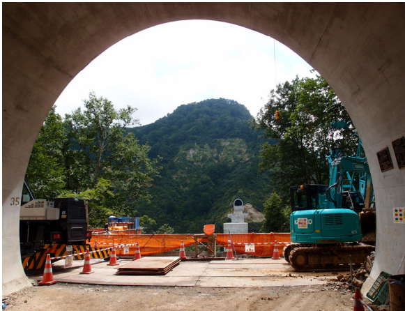
坪 谷 光 敏