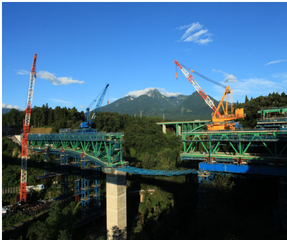
杉 野 健 二