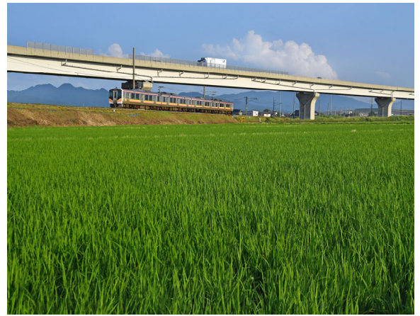
鷲 澤 拓 弥